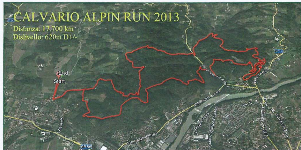
ESTRATTO DEL REGOLAMENTO

GARA ORGANIZZATA DAL GRUPPO ALPINI di GORIZIA DELL'ASSOCIAZIONE NAZIONALE ALPINI CON IL COMITATO PROVINCIALE DI GORIZIA DEL C.S.I. ED IL GRUPPO MARCIATORI DI GORIZIA, IN COLLABORAZIONE CON IL GRUPPO ALPINI di LUCINICO, IL PATROCINIO DEL COMUNE E DELLA PROVINCIA DI GORIZIA E DELLA SEZIONE A.N.A. DI GORIZIA.